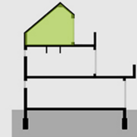
B épület metszet